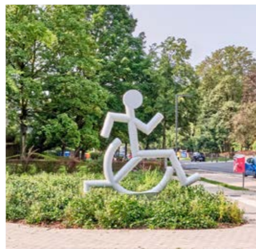
La sculpture Chais'Art Pressé, de Cléon Angelo, symbolise les efforts que les personnes en situation de handicap doivent fournir pour s'adapter à la société.

Organiser au sein des écoles et crèches le dépistage précoce de différents types de handicap (autisme, surdité etc.).