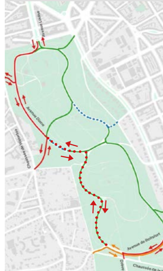
..... La proposition équilibrée d'Uccle face à la Ville de Bruxelles